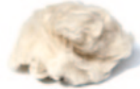
Yangir (Sibirischer Steinbock)