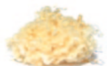
Arvenspäne / Schafwollkugeln