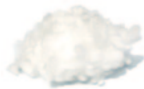
Tencel Lyocell Maisfaser