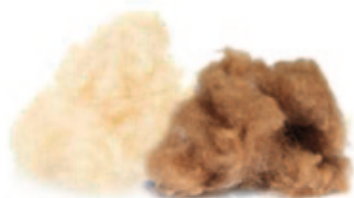
Wildseide / Kamel flaumhaar