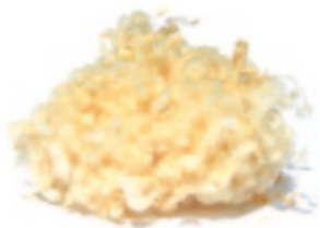
Arvenspäne / Schafwollkügelchen