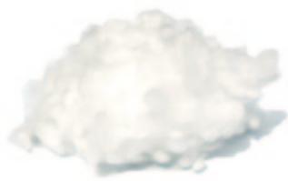
Tencel Lyocell Maisfaser