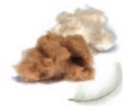
Kapok / Kamelflaumhaar Arktische Daune