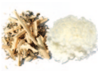
Kräutermischung / Schurwolle