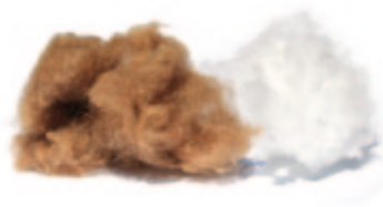
Kamelhaarflaum / Outlast