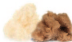
Wildseide / Kamelflaumhaar