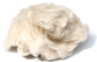
Yangir – Mongolischer Steinbock