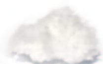
Tencel Viskose (aus Buchenholz) Polyester Hohlfaser